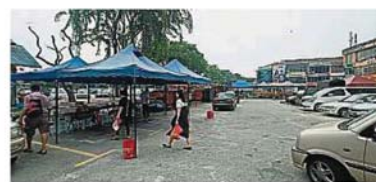
永安鎮7-11便利店前的停車場，從本月11日起將充作永安鎮年貨市集地點，為期14天的年貨攤期，到時將不允許泊車。