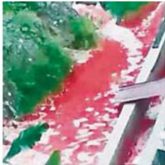
↑沟渠水上周因下雨而被不明物 体染色，顿时变成红沟渠，吓坏附近 居民。

Provided for client's internal research purposes only. May not be further copied, distributed, sold or published in any form without the prior consent of the copyright owner.