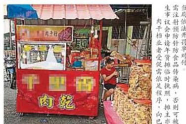
當局依法開罰單對付。生市議會申請年貨攤臨時執照，肉干小販業者受促從速依足程序，向巴生市議會申請年貨攤臨時執照，否則可被