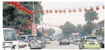
永安镇早市附近大红灯笼已高高挂起！

“巴生市议会则会于新年前夕，在巴生市区一带进行新春佳节装饰，包括巴刹路、苏丹依布拉克路高架天桥和哥打桥等，进行美化工作；反之，雪州行政议员兼巴生新镇州议员拿督邓章钦也会于1月12日，上午8时30分，在永安镇早市派发春联和年柑，与市民同庆佳节，希望大家踊跃参与和出席。”