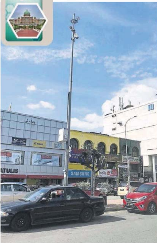
■設在加影市區的其中一台閉路電視。