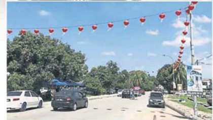
卫星市大路一带悬挂起大红灯笼，让整个市区充满迎春气息。

(巴生8日讯) 又是迎接庚子鼠年到来之时，巴生多个闹市已准备就绪，开始张灯结彩把大红灯笼高高挂起，让整个市区充满新春佳节的喜庆氛围！