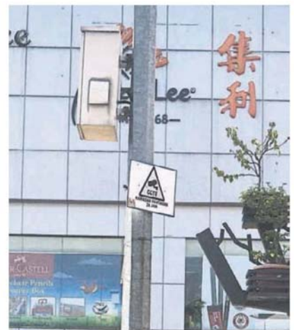
■安裝閉路電視的柱子上，注明閉路電視24小時操作，但否操作就不得而知了。