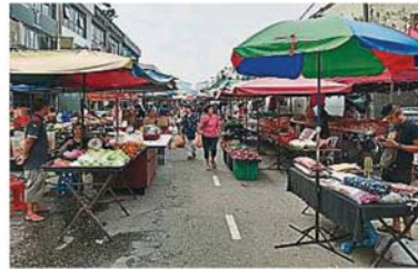
位于永安鎮早市路段的年貨市集，將在早市收攤後的大約中午12時開始擺攤至午夜時分。年貨攤到時不能占用道路太多空間，因路段仍需保留供通車之用。

嚴玉梅歡迎市民于來臨星期天(12日)上午8時30分，到永安鎮早市索取由雪州行政議員兼巴生新城區州議員拿督鄧章欽派發的年柑和春聯，一起過早年感染新春氣氛。