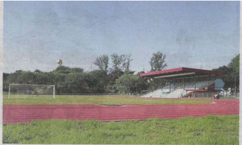
Refurbishment works at Klang's Stadium Sultan Suleiman is in its final stage but there is concern as the track gets waterlogged after heavy rain.

"The solution to this is to widen the cross culvert outside the stadium's perimeter fence next to