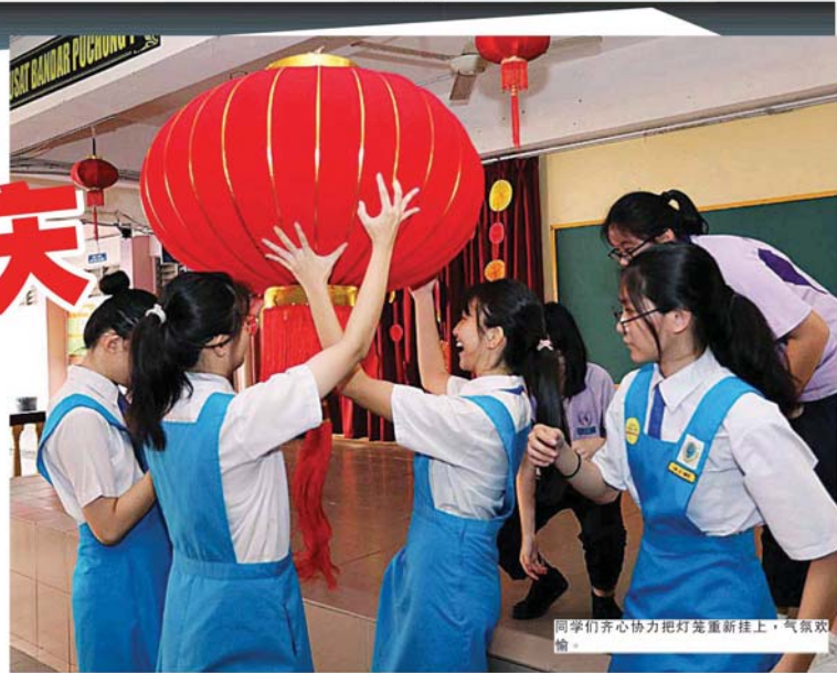
同学们齐心协力把灯笼重新挂上，气氛欢愉。