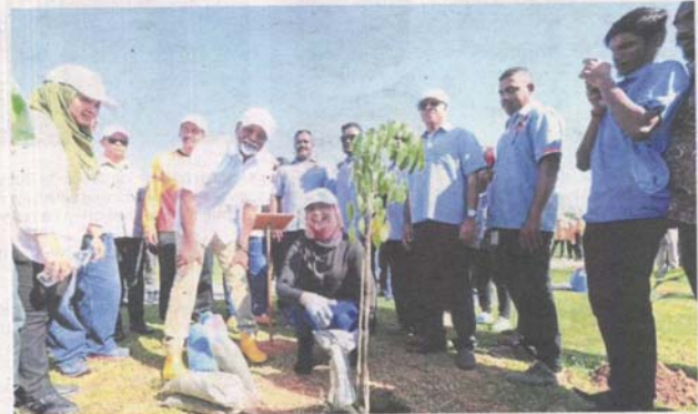
Xavier (fourth from left) and Water, Land and Natural Resources Ministry secretary-general Datuk Zurinah Pawanteh (centre, in black top) after planting a merbau tree during the pre-launch of the programme at Bandar Botanic Park in Klang.

"People need to understand the water industry must have more money so we can have supply 24 hours a day throughout the