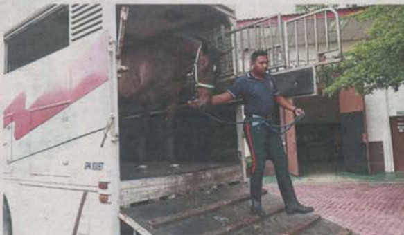
A DBKL employee leading a horse out from a transporter at the Taman Tasik Titiwangsa stable after a patrol at another park.