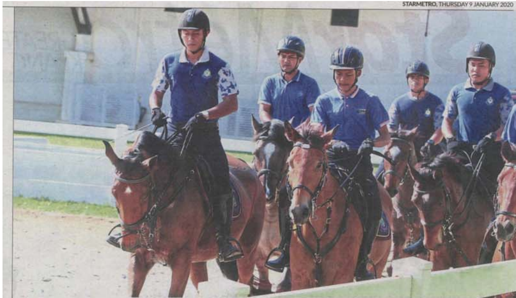
PPJ enforcement officers undergoing horse-riding training at the Horse Unit Complex in Putrajaya.