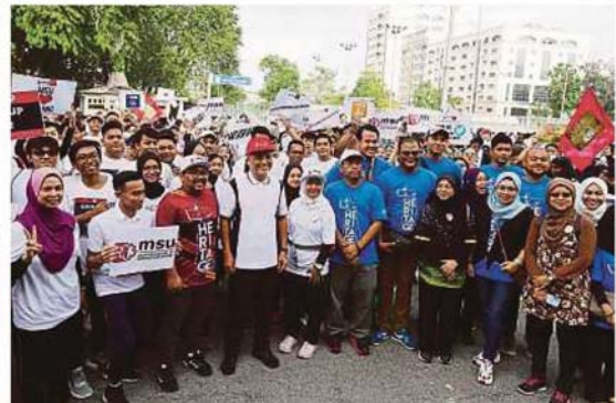
PESERTA mengambil gambar kenangan.