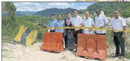
非法進入市議會已查封有人不獲