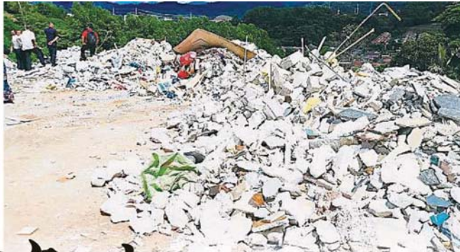
→位于打昔柏迈新村与乌鲁冷 岳路之间一块地势高的空地，出现 大量建筑废料。