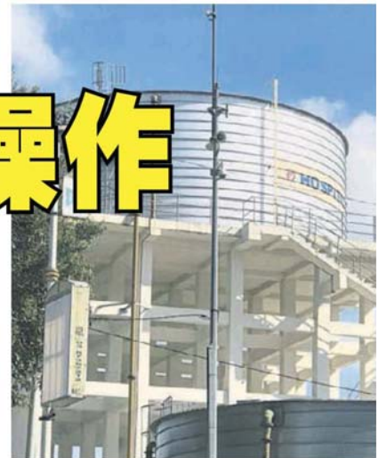
■士毛月路加影醫院外面，也有一台閉路電視。