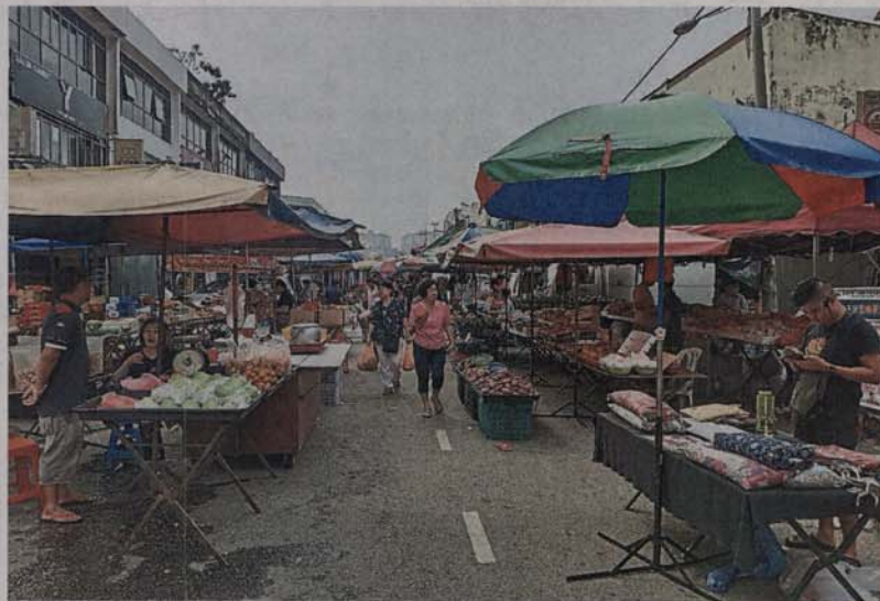
■永安镇早市路段的年货市集，将在中午12时后开始摆档至午夜时分。

巴生永安镇新春年货市集档口设在7-11便利店前的停车场和早市结束后的早市路段，目前已开放供商家申请，巴生市议会将以先到先得方式处理，因此有意者受促从速提交申请。