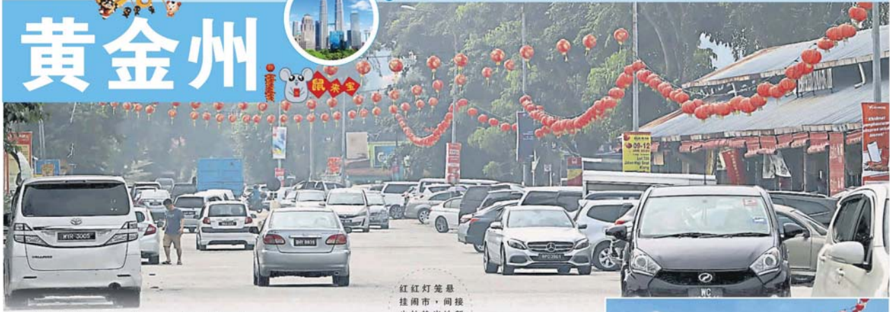
红红灯笼悬挂闹市，间接也炒热当地新春气息。