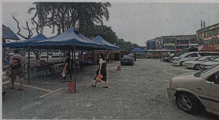
■从本月11日起，永安镇7-11便利店前的停车场，将充作14天年货市集地点，到时将不允许泊车。

“新春年货市集结束后，小贩必须在1个月内，即1月27至2月26日，申请索回300令吉抵押金。只要符合条例，市议会便会归还抵押金，一旦过了期限，市议会会有权拒绝归还。”（TSI）