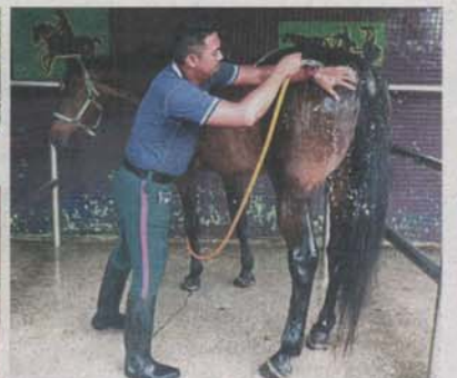
A worker at DBKL's Taman Tasik Titiwangsa horse stable bathing a horse after a morning patrol.