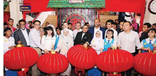
旺阿兹莎(左 5) 率领内阁正副部长巡视蒲种市国中一校，为这所面对土权党压力而取下新春装饰的学校打气。左起为希维尔、黄基金、张念群、林冠英、赛夫丁阿都拉、慕扎希、哥宾星、赛沙迪及黄思汉。