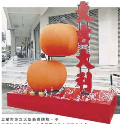
卫星市设立大型新春牌坊，不仅有助炒热气氛，也希望可成为人们打卡地点。