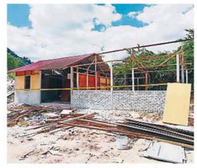
非法垃圾场旁出现一座非法建筑物，安邦再也市议会已拉起警戒线。